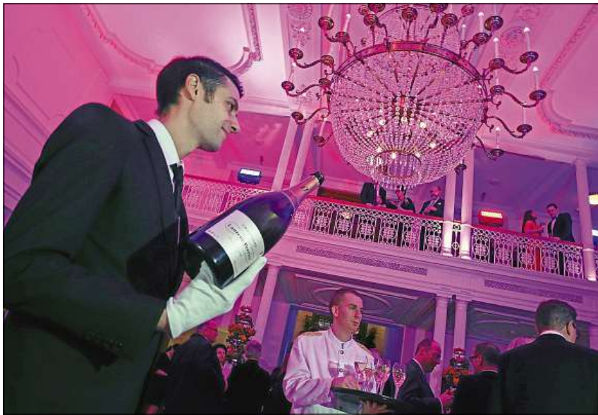
Schampagn sco apéritif, quai tutga tar ena tala occurrenza.