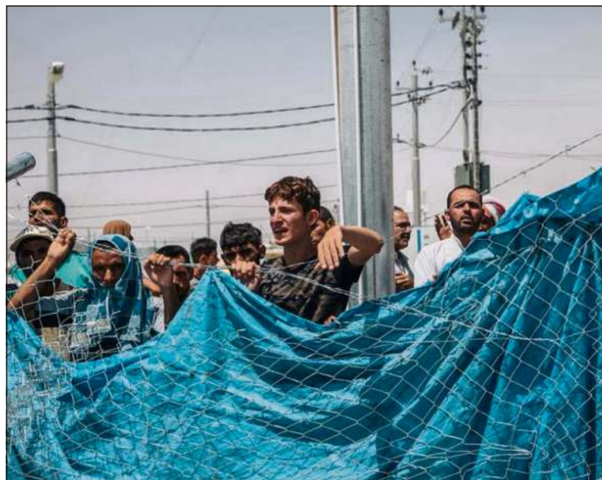
Cun saivs e barricadas na pon ins betg schliar il problem dals fugitivs.

* Migration – selbst gewählt und fremd bestimmt. En: «Ost-West» 4/1916. Regensburg (Verlag Friedrich Pustet, ISSN 1439-2089), pp. 241–316.