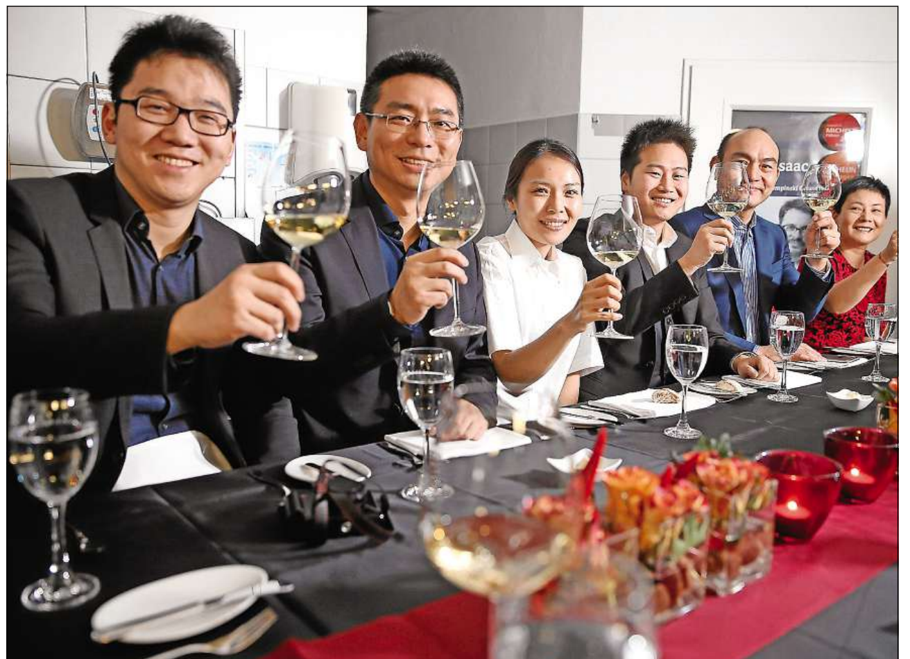
Schampagn sco apéritif, quai tutga tar ena tala occurrenza.

Ils diners da gala en ils hotels da tschintg stailas èn lura er adina ina part dal Gourmet Festival ed er qua vegn be servì il meglier ed il pli bun. Popularas èn lura er las diversas degustaziuns, saja quai da vins e champagn, da grappas e liqueurs, da chaschiel e da charn sco er da tschigulatta ed auters dulstschems fins. Bunamain legendara è lura la uschenumnada «Kitchen Party» en il Badrutt's Palace hotel a partir da las 22.30, nua che tuts dastgan guardar als cuschinunzs en las padellas e gist degustar las bunas chaussas en il lieu (330 francs per persuna). La curuna per mintga participant da l'emna per gourmets è bain il grond final en il Kulm Hotel da damaun venderdi a partir da las 19.00. Da quellas uras cumenza il grond banchet da gala, (550 francs per ina persuna), nua ch'i vegn servì in menu cun divers plats e quai en la sala, decorada da festa a la moda englausa, da l'hotel da luxus. Mangià vegn al «Table d'Hôte», vul dir tuts èn tschentads communaivel a maisa e sa laschan ir bain cun tratgas da buna qualitat che vegnan preparadas quest onn dals cuschiniers da l'Engalterra. Bun appetit!