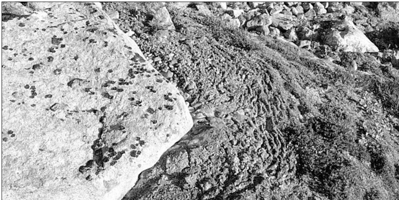
Efects da la schelira permanenta en Bregaglia.