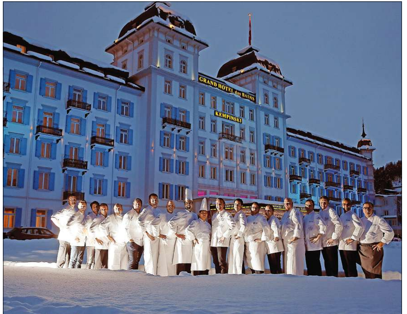
Ils cuschiniers da la Gronda Britannia cun lur collegas dals hotels da luxus a San Murezzan.