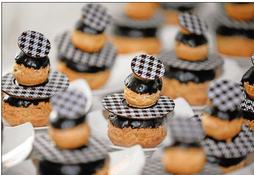
Piculezzas finas da buna qualitat per ils mangiabains.