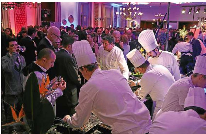
L'avertura ha gi lieu en la sala dal Kempinski Grand Hotel des Bains a San Murezzan.