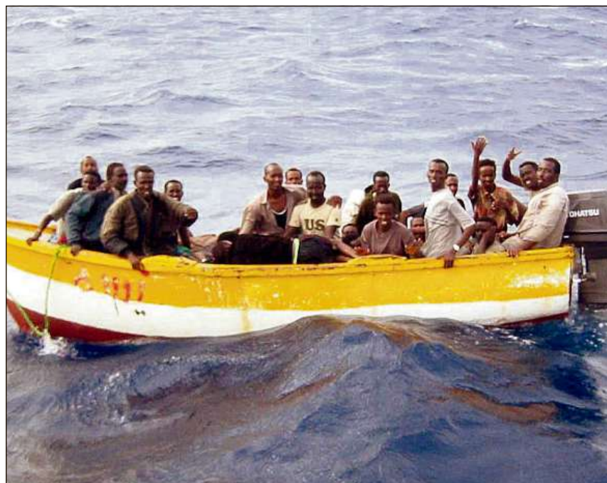
Fugitivs da l'Africa sin lur viadi intscher vers l'Europa.