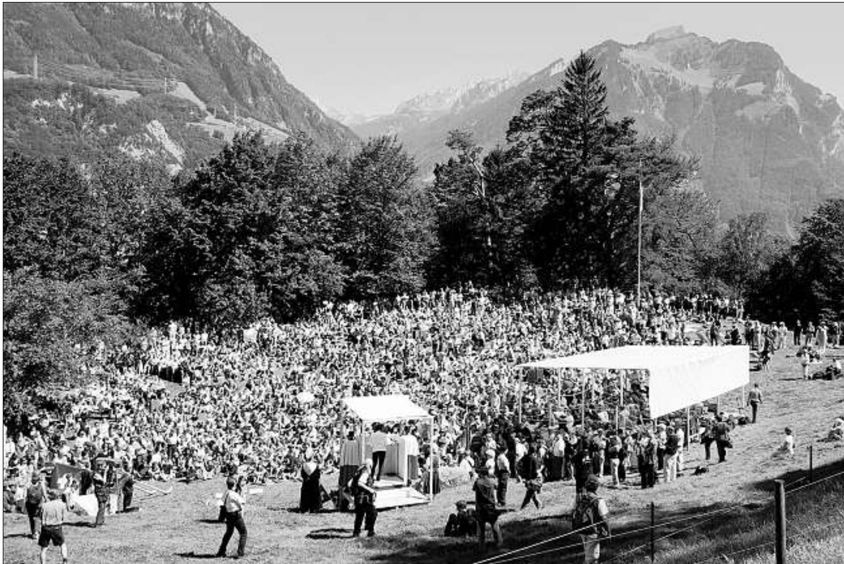
La prada dal Rütli è daventada il simbol per la naschientscha da la Confederaziun svizra.