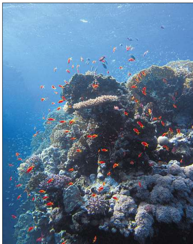
La biodiversità cumpiglia plirs nivels d'organisaziun dals organismms.

- Monocellulars (27 000 spezias) - Spungias (5000 spezias) - Celenterats (9000 spezias) - Verms plats (12 650 spezias) - Verms radunds (12 480 spezias) - Anellids (17 000 spezias) - Atropods (1 000 000 spezias) - Molluscs (130 000 spezias) - Dermaspinas (6000 spezias) - Vertebrats (46 500 spezias)