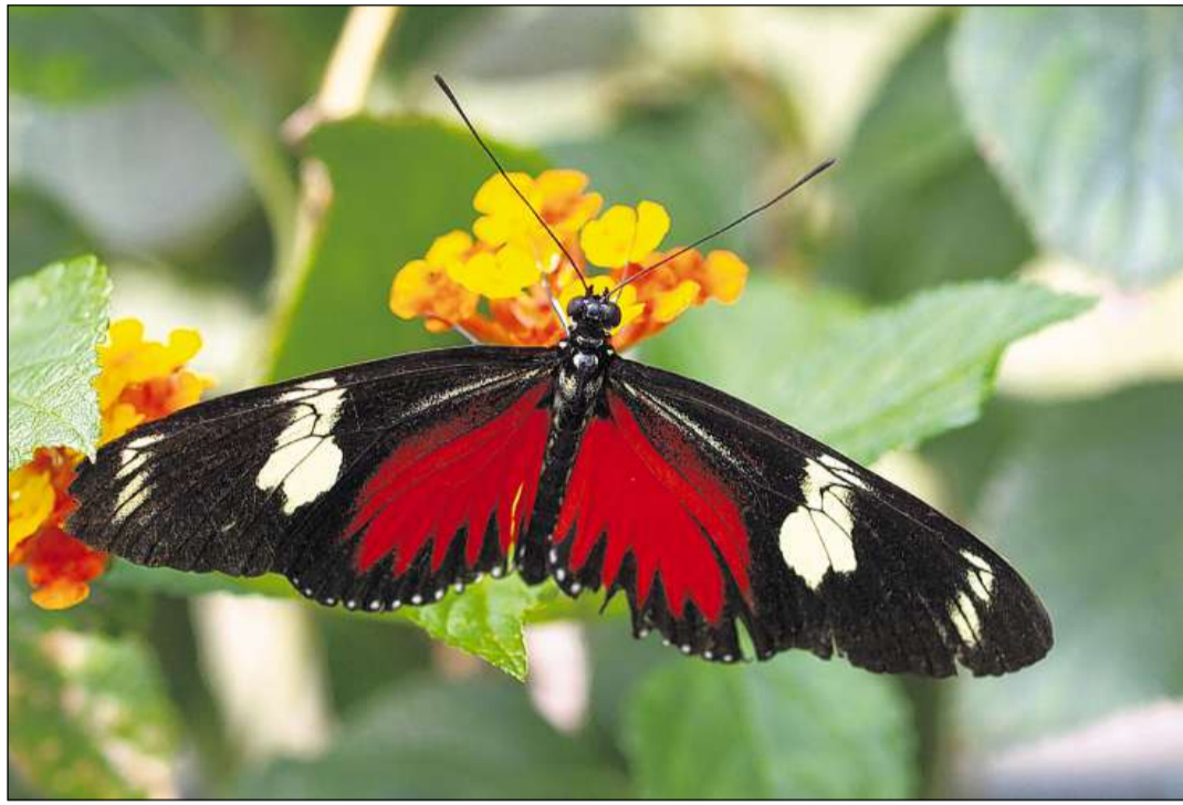
La mesadad da tut las spezias descrittias fin oz èn insects.

sche gl da la cella (las bacterias); da stgaffir in agen reginavel dals monocellulars (ils protists); da sparter ils bulieus da las plantas. En pli discurren ils scenziads oz savens da trais domenas (geneticas) ch'èn surordinadas als singuls reginavels: las bacterias, las archaeas (che tutgavan pli baud tar las bacterias) e la terza domena che cumpiglia tut las creatiras cun nusche gl da la cella (ils